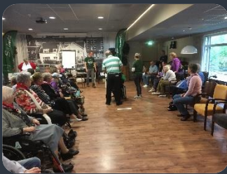
Bean bag baseball toernooi